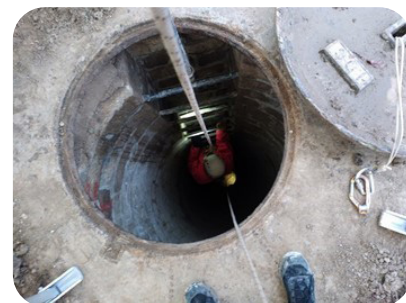
Entrée du puits sécurisé