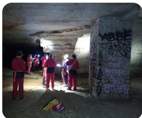
Découverte du site et orientation souterraine pour les élèves de première.

Informations : monvoisin.gael@gmail.com / speleotruck@gmail.com